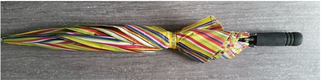
Parapluie "électoral" laissé à la salle des fêtes lors des élections présidentielles