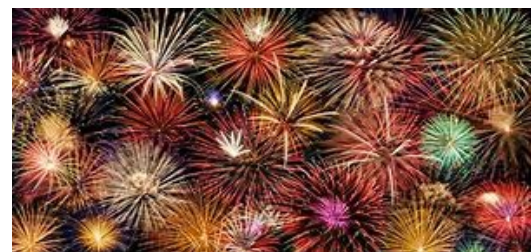
Berteaucourt-Thennes 13 juillet 2018

Il sera suivi d'un vin d'honneur servi sous le préau de la salle des associations, près du stade.